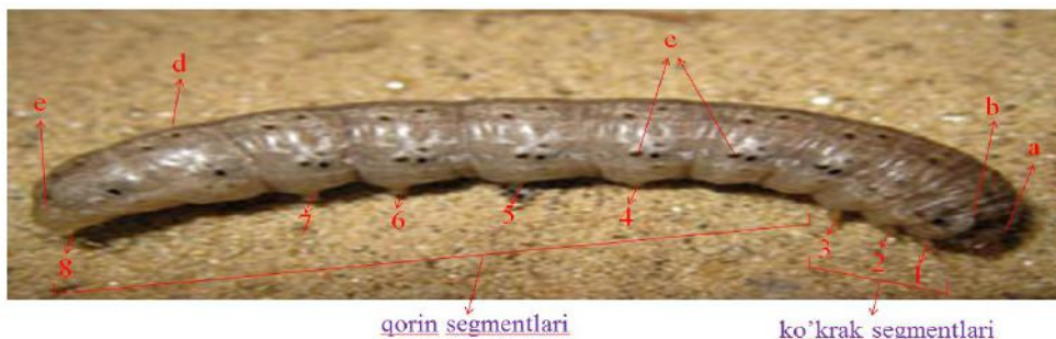
a-bosh qismi, b-ko'krak qalqoni, c-nafas teshiklari, d-qilchalar, e-anal qalqoni, 1,2,3-ko'krak oyoqlari, 4,5,6,7,8-qorin oyoqlari. Agrotis obesa