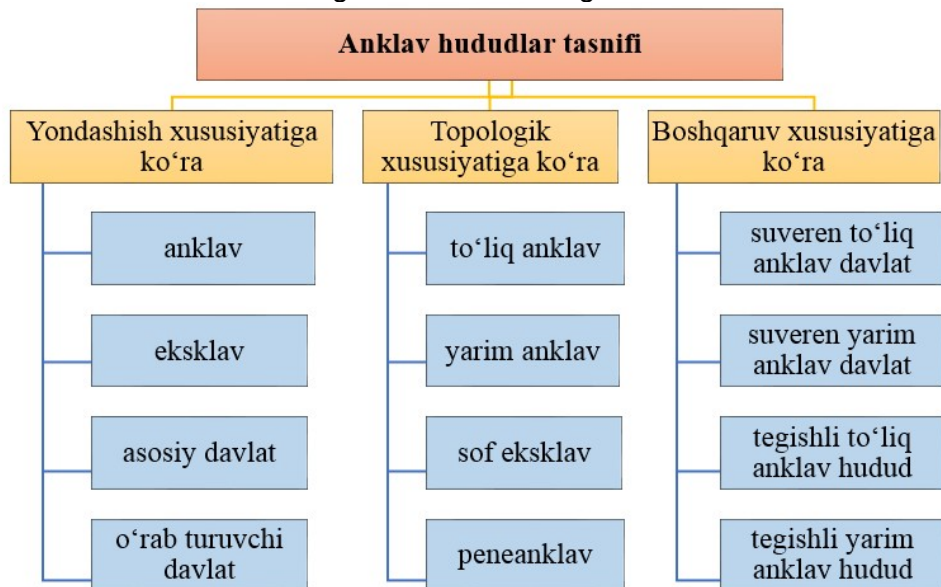
1-rasm. Anklav hududlarning namoyon bo'lish shakllari

Anklav (fransuzcha, enclave – «qulflab olish», «o'rab olish») – bu bir davlatning hamma tomondan boshqa davlat hududi bilan o'rab olingan hududi yoki hududining bir qismi hisoblanadi [26; 351-b.], ya'ni anklav – bir mamlakatga tegishli, ammo boshqa davlat chegaralari ichida joylashgan hudud hisoblanadi [27; 84-b.]. Chunonchi, San-Marino Italiya Respublikasining ichida, ya'ni hamma tomondan uning hududi bilan o'ralgan davlat.