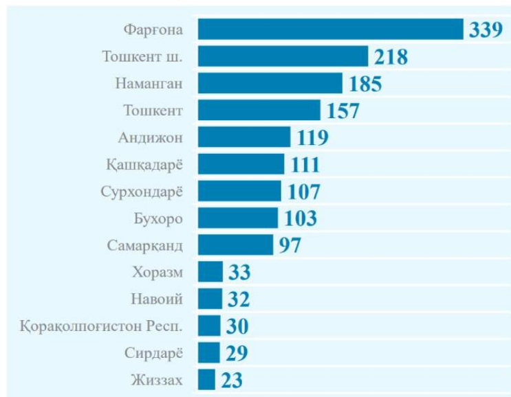
Jinoyat sodir etgan voyaga yetmaganlarning hududlar bo'yicha taqsimlanishi (2023-yil yanvar-iyun oylari uchun, kishi)

Bu muammo, albatta, zamonaviy jamiyatdan voyaga yetmaganlar huquqbuzarligiga qarshi kurashning institutsional modelini yaratishga kompleks ijtimoiy-huquqiy yondashuvni talab qiladi.