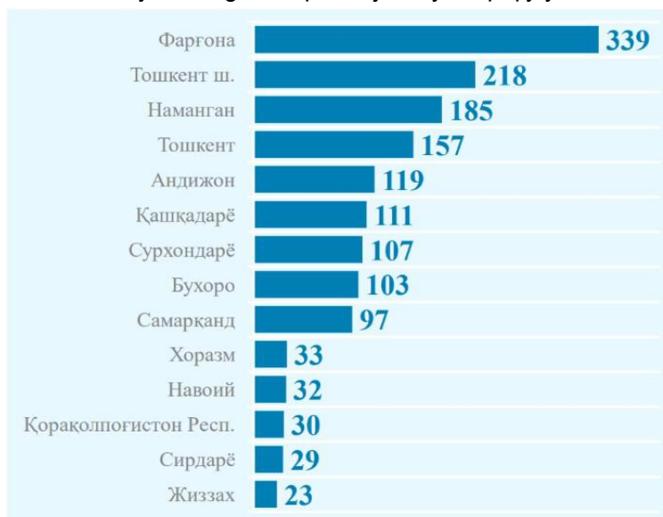
Jinoyat sodir etgan voyaga yetmaganlarning hududlar bo'yicha taqsimlanishi (2023-yil yanvar-iyun oylari uchun, kishi)

Bu muammo, albatta, zamonaviy jamiyatdan voyaga yetmaganlar huquqbuzarligiga qarshi kurashning institutsional modelini yaratishga kompleks ijtimoiy-huquqiy yondashuvni talab qiladi.