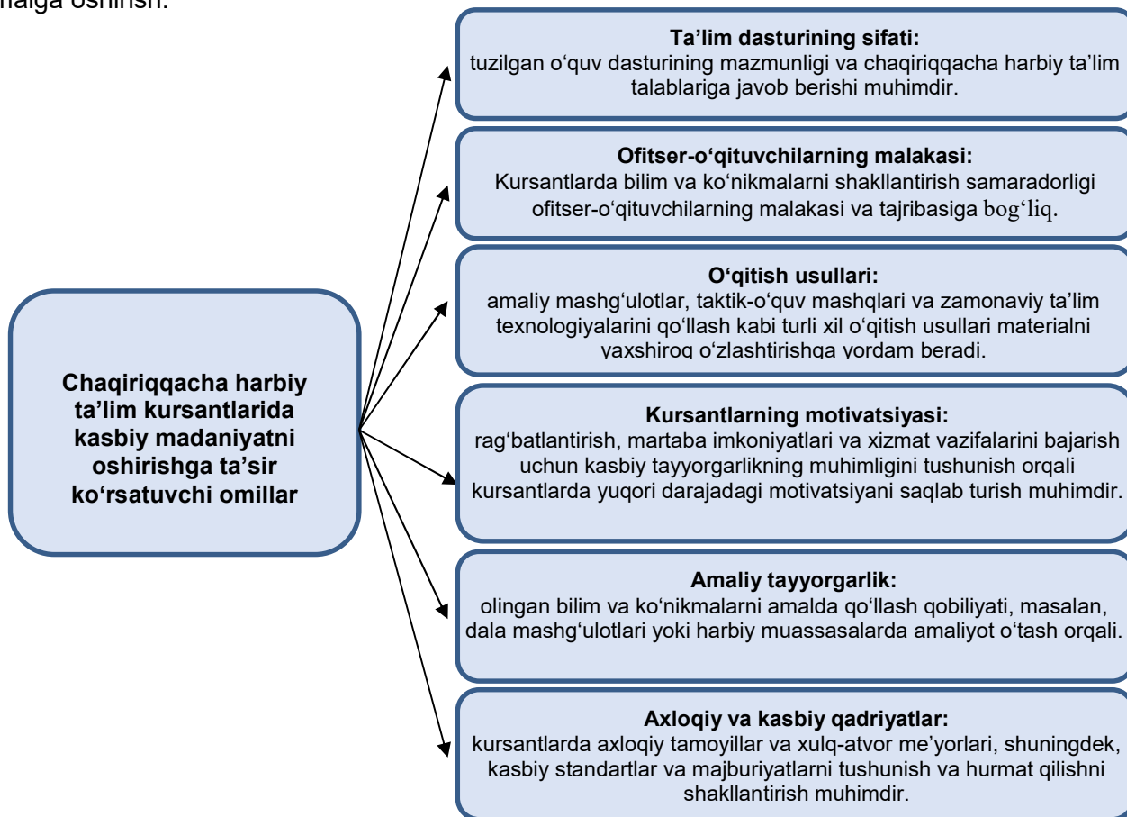
2.7-rasm. Chaqiriqqacha harbiy ta'lim kursantlarida kasbiy madaniyatni oshirishga ta'sir ko'rsatuvchi omillar

Uchinchidan, kursantlarda kasbiy madaniyatini nazariy va amaliy bilimlar bilan boy etish, milliy qadriyatlarimiz asosida ma'ruzalar va munozaralar o'tkazish, tarixiy meros yodgorliklariga ekskursiyalarni tashkil etish, Amir Temur, Jaloliddin Manguberdi kabi buyuk sarkardalarimizning jasorati va vatanparvarligini targ'ib etishga bag'ishlangan kurslar va tadbirlarni tashkil etish orqali amalga oshirish.