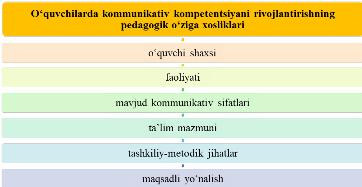
1.22-rasm. O'quvchilarda kommunikativ kompetensiyani rivojlantirishning pedagogik o'ziga xosliklari

Izlanishlarimiz doirasida tadqiqotchi-olimlarning "kommunikativ kompetensiya" tushunchasi mazmuni va ushbu kompetensiya tuzilishiga oid yondashuvlarni tahlil qilgan holda o'quvchilarda kommunikativ kompetensiyani rivojlantirishning o'ziga xos muhim pedagogik o'ziga xos jihatlari ajratib ko'rsatamiz (1.2.2-rasmga qarang):